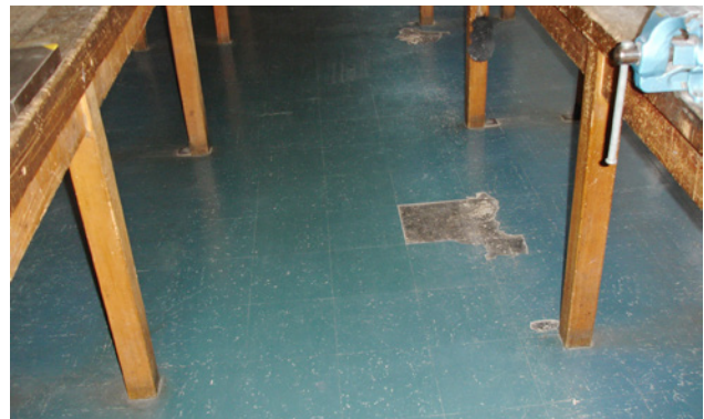
1 Einschichtige sogenannte Floor-Flex-Beläge. Hier ist der Asbest in der Matrix festgebunden.

Besteht der Verdacht, dass beim Entfernen von Wand- und Bodenbelägen aus Kunststoff Asbest auftreten kann, so sind die Gefährdungen vor Beginn der Arbeiten genau zu ermitteln.