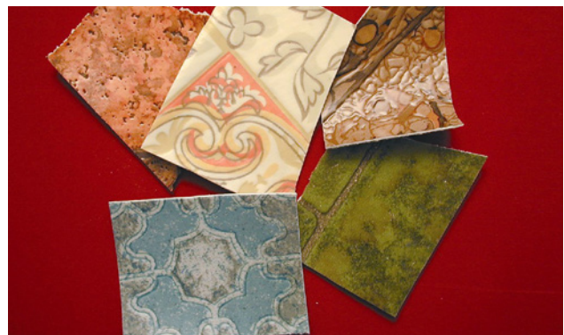
2 Mehrschichtige Bodenbeläge (Cushion-Vinyl) bestehen in der Regel aus PVC mit einer Trägerschicht aus schwachgebundenem Asbest.